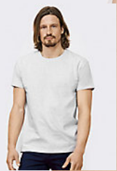
SOL'S IMPERIAL 11500