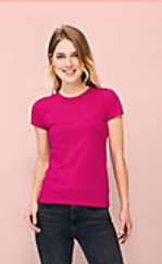
SOL'S MISS 11386