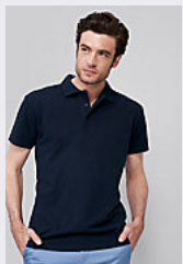
SOL'S SUMMER II 11342