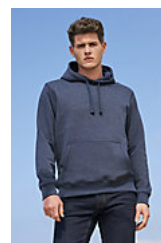
SOL'S SPENCER 02991