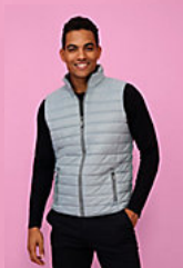
SOL'S WAVE MEN 01436